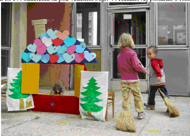
MDD sme oslávili pohybovými aktivitami na tému „Z rozprávky do rozprávky“