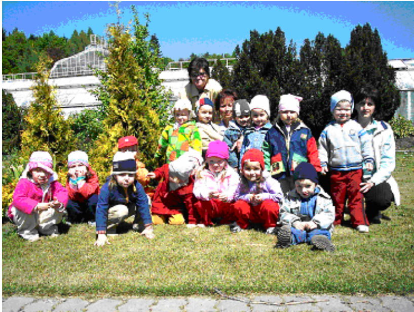
Pred skleníkom botanickej záhrady