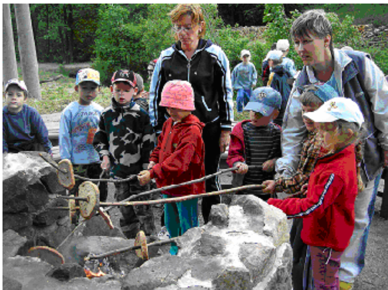
Aj romantická chvíľka pri ohníku nám spestrila pobyt