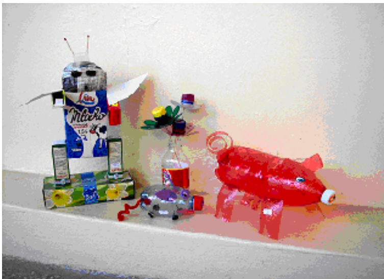
Kreativita rodičov sa prejavila pri výrobe predmetov z odpadového materiálu pri príležitosti Dňa Zeme.