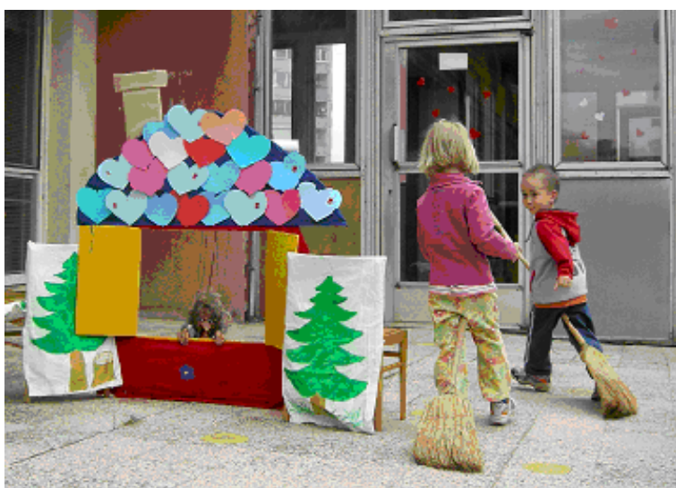
MDD sme oslávili pohybovými aktivitami na tému „Z rozprávky do rozprávky“