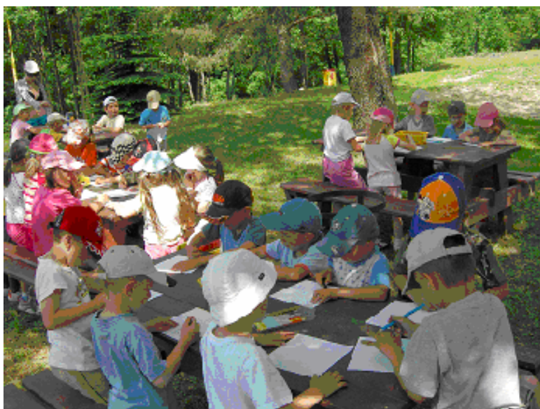
21. až 25 mája deti z prípravných oddelení absolvovali Školu v prírode v rekreačnom zariadení na Zlatej Idke.